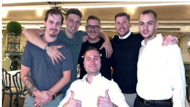
Phönixer - Abi 14 und 15